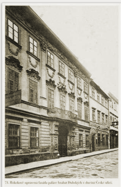
71. Bokokosé upravená fasáda paláce hraběte Dvorských v úhelní České ulici.